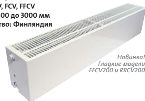
Новинка! Гладкие модели FFCV200 и RRCV200

Тип: 21, 22, 33, 44 Модели: CV, FCV, FFCV Длина: от 600 до 3000 мм Производство: Финляндия